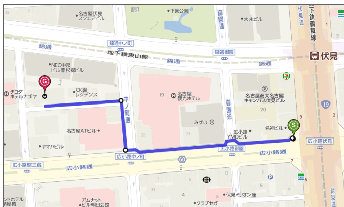
■地下鉄東山線・鶴舞線「伏見駅」 8番出口より徒歩5分